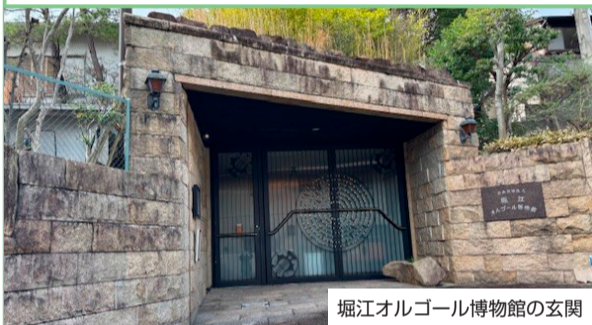
堀江オルゴール博物館の玄関

西洋の貴重なアンティークオルゴールや自動演奏楽器を公開している博物館が、西宮市苦楽園の閑静な住宅街にあります。1993(平成5)年に開館した堀江オルゴール博物館で、実業家の故堀江光男氏(1911~2007)が世界を回って蒐集した約360台を収蔵しています。