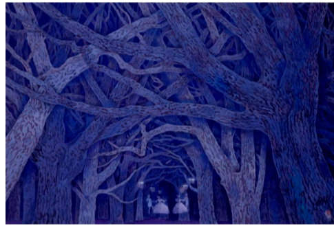
東山魁夷《森の幻想》1971年 兵庫県立美術館蔵