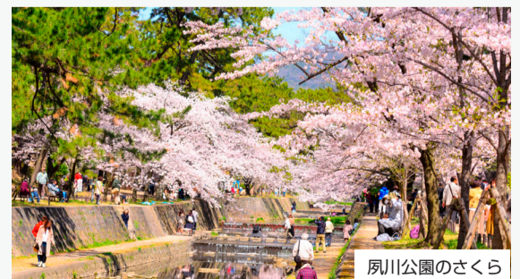
夙川公園のさくら

整備されています。桜が植栽され、日本さくらの会選定の「さくら名所100選」にも選ばれています。とりわけ阪急電車の夙川駅から苦楽園口駅にかけては毎年4月上旬にかけて大勢の花見客でにぎわいます。