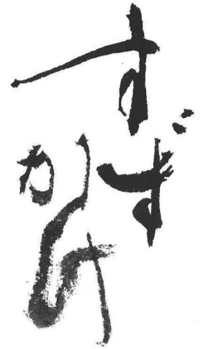
題字：井茂圭洞 (書家・文化勲章受章者)