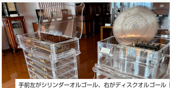
手前左がシリンダーオルゴール、右がディスクオルゴール

職人の手づくりだったシリンダー式は富裕層が楽しんでいたのに対し、ディスク式はドイツ