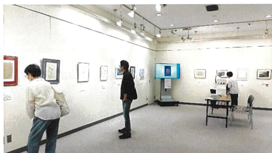
神戸会場(兵庫県民アートギャラリー)