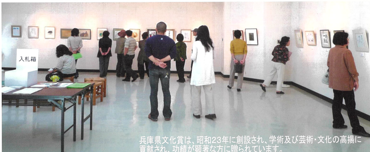
兵庫県文化賞は、昭和23年に創設され、学術及び芸術・文化の高揚に貢献され、功績が顕著な方に贈られています。