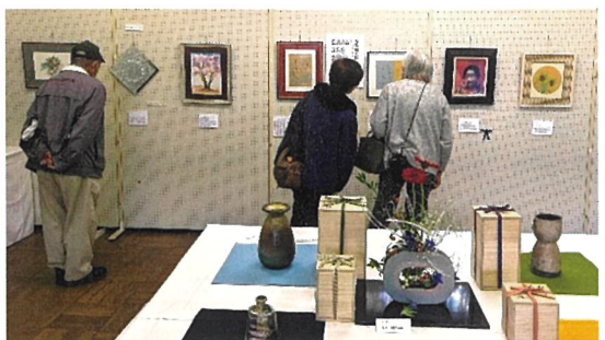
加古川会場(兵庫県いなみ野学園)