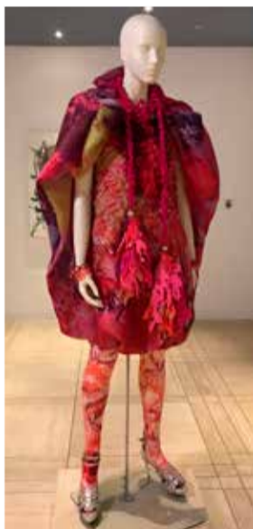
コシノヒロコのデザイン「2013年春夏コレクション」

美術館では、18世紀から現代までの西洋を中心に70カ国・地域に及び民族衣装など約9千点のコレクションを収蔵しています。ただ、館のコンセプトは服飾だけにとどまりません。「ファッション」を衣・食・住・遊にわたる総合文化として広くとらえ、生活に潤いを与える「ファッション」の魅力を発信することを目指しています。