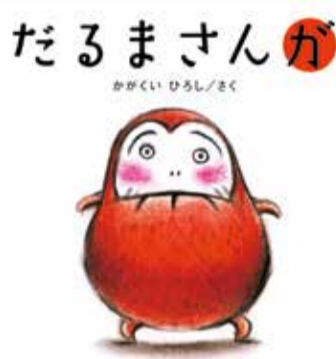
「だるまさんが」2008年 ブロンズ新社

逝するまでのわずか4年間に16冊の絵本を遺しました。作品の原画や創作ノートを展示し、アトラクション映像もあります。夏休みに子ども連れで気軽に