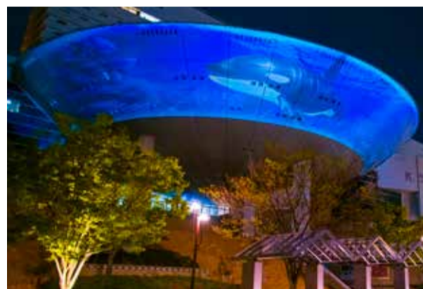
建物の外壁を活用したプロジェクションマッピング

▶神戸ファッション美術館=神戸市東灘区向洋町中2-9-1。開館時間は10時～18時(入館は17時半まで)。休館は月曜(祝休日の場合は翌平日)、年末年始、展示替え期間。観覧料は展覧会ごとに設定。「かがくいひろしの世界展」は一般1000円(800円)、大学生・神戸市外在住の65歳以上500円(400円)、高校生以下・神戸市内在住の65歳以上無料。( )内は当協会友の会会員料金。JR「住吉駅」または阪神「魚崎駅」で六甲ライナーに乗り換え「アイランドセンター駅」下車、南東徒歩3分。☎078・858・0050