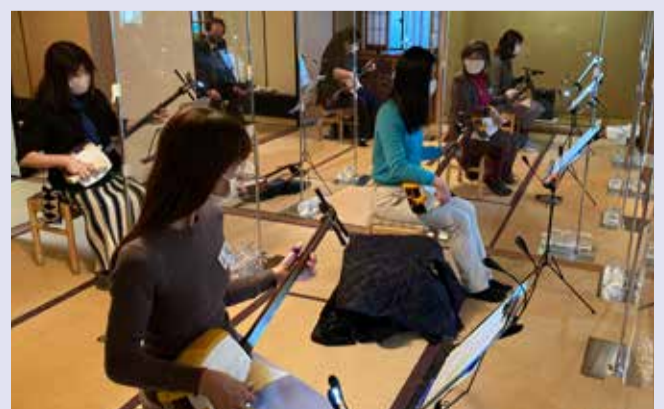
初めての方でも気軽に学べる講座です

三味線の魅力を分かりやすく紹介する入門体験講座です。実際に三味線に触れて弾いてみませんか。 【日時】8月24日(土)13時30分~15時30分 【場所】兵庫県公館 楠園亭 【講師】日本民謡・民舞兵庫県連合会 【定員】10人(先着順) 【参加費】無料 【申し込み方法】氏名、年齢、〒住所、電話番号、FAX番号を記入のうえ、当協会文化振興部(FAX 078-321-2139)まで。 【問い合わせ】当協会文化振興部 ☎078-321-2002