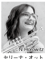
セリーナ・オット