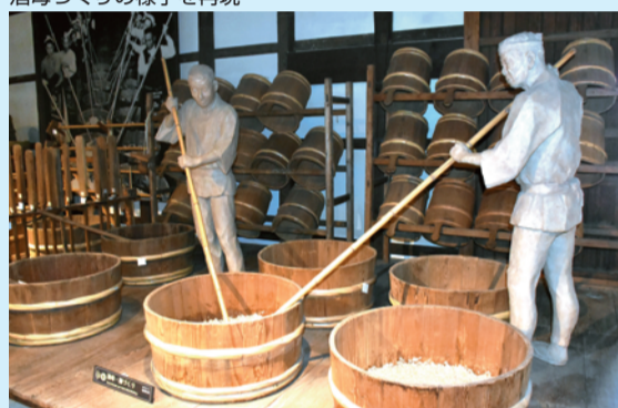
酒母づくりの様子を再現

高さ2.3mあり5400ℓ(30石)入るそうです。最後に四斗樽(72ℓ)に詰められ、出荷されます。館内には1995(平成7)年の阪神・淡路大震災で全壊した旧酒蔵館の様子も展示し、震災の記憶を伝えています。