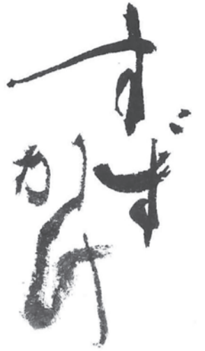
題字：井茂圭洞 (書家・文化勲章受章者)