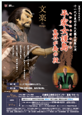
6月29日公演のチラシ

【定員】40人【申し込み・問い合わせ】当協会文化振興部 ☎078・321・2002