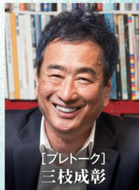
【ブレイク】 三枝成彰