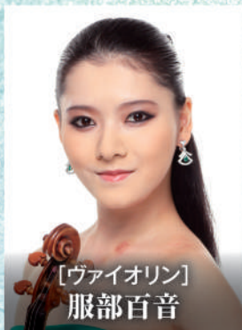
【ヴァイオリン】 服部百音

オープニングは三枝成彰作曲、世界的な大ヒットアニメ 機動戦士ガンダム「逆襲のシャア」より「メインタイトル」をお送りします。