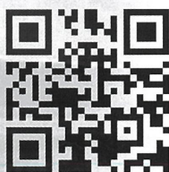
公式ホームページ