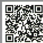
バスマーケット QR コード