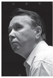
ミハイル・プレトニョフ