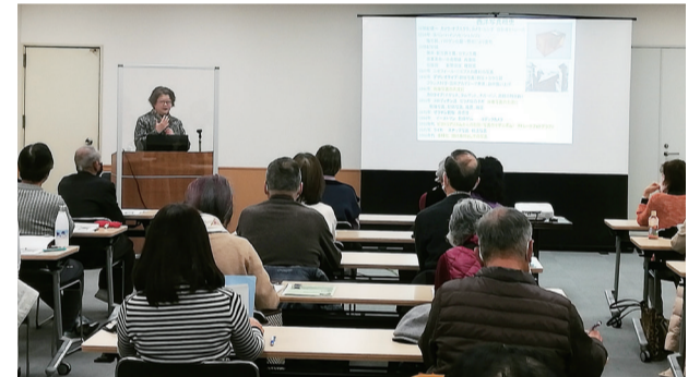
西洋美術講座の講座風景。令和5年度は西洋建築がテーマです