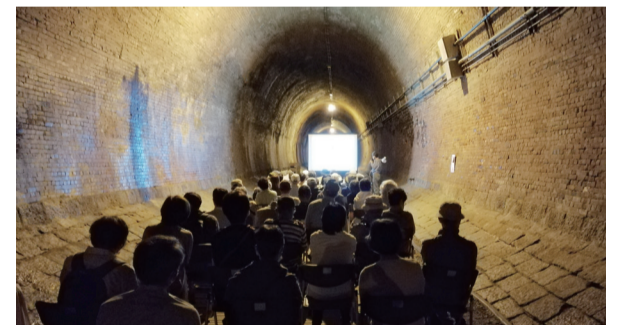
昨年実施した「湊川隧道特別見学会」

今回ご紹介した通年講座のほか、気軽に参加いただける短期講座も実施します。短期講座は本紙で順次ご案内させていただきます。