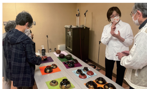
第一線で活躍する講師陣を迎えて開催する「兵庫県生活文化大学」(写真は「文化財講座」)