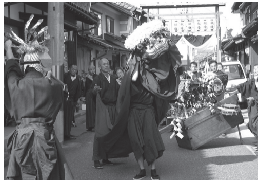
鶴岡太神楽保存会