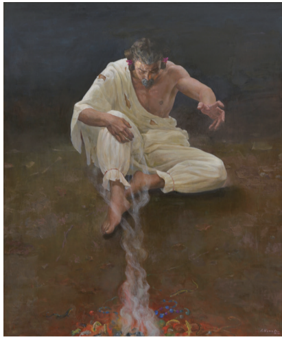
洋画「伊邪那岐命の悲しみ」小灘一紀 (理事)

読者プレゼント チケットを抽選で5組10人に。応募方法は本紙2面。2月13日(月)必着。