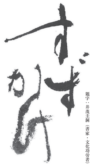
題字・井茂圭訓(書家・文化功労者)

兵庫県芸術文化協会 発行所 (公財)兵庫県芸術文化協会文化振興部 〒650-0011 神戸市中央区下山手通4丁目16番3号 (兵庫県民会館内) ☎078-321-2002 編集・発行人/西上三鶴 (公財)兵庫県芸術文化協会理事長 https://hyogo-arts.or.jp