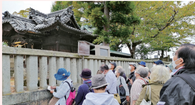
徒歩で各地の史跡や文化財等を訪ねる「ふるさとウォーク」