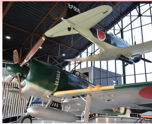
飛行機の実物大模型。「紫電改」(手前)と宙吊りの「九七式艦上攻撃機」