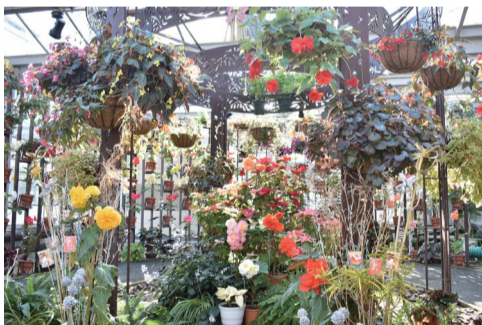
大温室では冬でも色とりどりのベゴニアが楽しめる