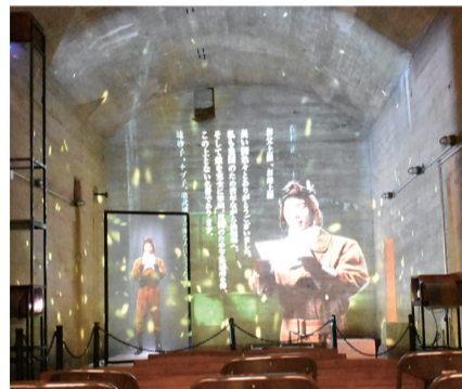
巨大防空壕の内部に設けられたシアター