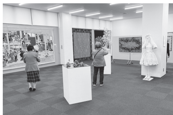
昨年に西脇市で開催された巡回展

巡回展を開催します。全回手工芸コンクール in ひょうごの上位特別受賞作品(11月16日(水)～19日(土)10時30分～17時) *初日は11時からオープニングセレモニー、11時30分開場。最終日は16時まで。【場所】川西市立ギャラリーかわにし(川西市栄町20番1号「川西能勢口」駅舎1階) 【問い合わせ】兵庫県婦人手工芸協会 ☎080・5305・7902 (大竹)