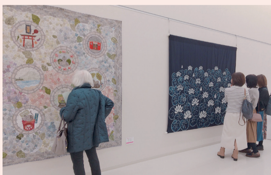
昨年の展示会の様子。工夫を凝らした作品の数々が来場者の目を楽しませました

◇ ◇ 【会期】11月11日(金)～13日(日) 【開館時間】10時～17時(最終日は15時まで) 【観覧料】無料 【場所】原田の森ギャラリー本館 2階大展示室(神戸市灘区原田通3-8-30) 【問い合わせ】当協会「手工芸コンクール」係 ☎078・321・2002