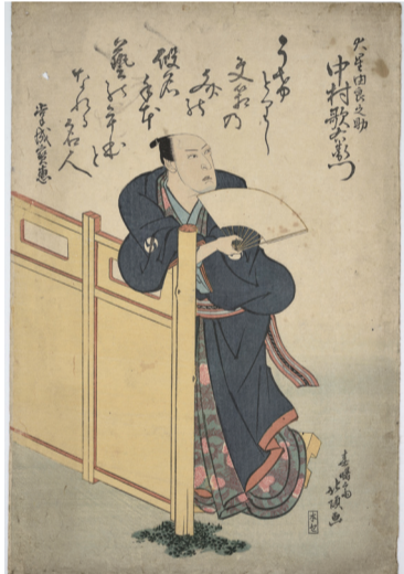
上方浮世絵の作品。「大星由良之助 中村歌右衛門」春曙齋北頂 文政7年(1824) 赤穂義士会蔵

お出かけ ちょっとメモ ▶赤穂市立歴史博物館＝赤穂市上飯屋916-1。開館は9時～17時(入館は16時半まで)。休館日は水曜(祝日の場合は翌日)、年末年始(12月28日～1月4日)。入館料は大人(高校生以上)200円(160円)、小中学生100円。特別展開催中は大人300円(240円)、小中学生150円。( )内は当協会友の会会員料金。JR播州赤穂駅から徒歩20分。☎0791-43-4600 ▶大石神社義士史料館＝赤穂市上飯屋131-7(旧城内)。拝観は8時半～17時。年中無休。拝観料は大人(高校生以上)450円、小人(中学生以下)無料。友の会会員は220円。JR播州赤穂駅から徒歩15分。☎0791-42-2054