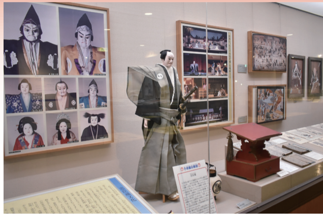
忠臣蔵の文化を紹介する赤穂義士コーナー

赤穂はまた、古くから塩の産地として栄えてきました。博物館の愛称は「塩と義士の館」。常設展示は開館当初から、「塩」「城下町」「義士」「旧上水道」の4つのテーマで構成されています。さらに企画を練った特別展を年1回のペースで開いて