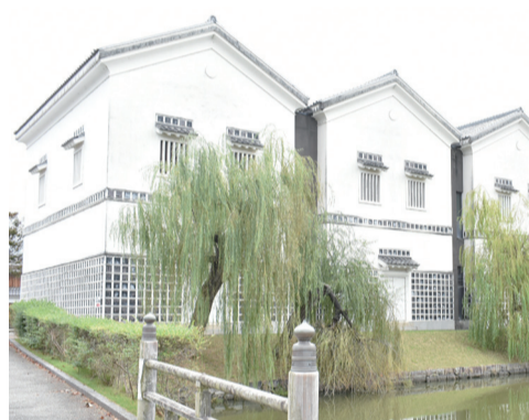
赤穂城跡から望む歴史博物館。土蔵風の外観が目を引き

「赤穂の塩」コーナー。塩廻船や石釜の模型、重要な有形民俗文化財の製塩用具を展示、古代から近代までの製塩法の移り変わりが学べます。 2階は常設の3コーナーと特別展示室に分かれています。天守閣がない海岸平城の全景が分かる赤穂城のジオラマ、義士シアターでは「史実元禄赤穂事件」と「仮名手本忠臣蔵紹介」の2本の映像(各約12分)が見られます。