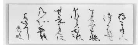
2021年の第8回日展(万)に出品された「秋風」縦70cm×横22.5cm