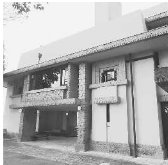
ヨドコウ迎賓館の玄関

国指定重要文化財のヨドコウ迎賓館(旧山邑家住宅)は、芦屋市の阪急芦屋川駅を降りて北へ徒歩10分ほどで着く。