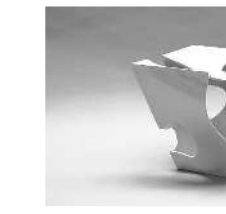
八代 清水六兵衛 輝白陶姿 24-B 2012年

②2月27日(日)まで ⑩10時～18時、入館は17時30分まで ㊨月曜日 ㊨一般600円(友の会会員は500円)、70歳以上300円、大学生500円、高校生以下無料 ㊨江戸中期から続く京都の陶家・清水六兵衛氏の当代、八代清水六兵衛氏。建築学を学んだ経験を活かし、設計図に合わせて土の板を切り、パーツを結合させた構造的な造形に、焼成による歪みを意図的に取り入れた大型作品などを紹介します。特別展「やきものの模様―動植物を中心に―」が同時開催中です。 ㊨兵庫陶芸美術館 ☎079・597・3961