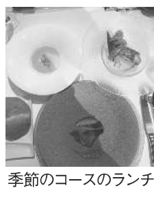
季節のコースのランチ

建物には旧芦屋郵便局電話事務室で、国登録有形文化財である。1929年に完成した。