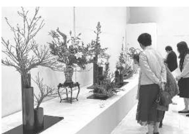
兵庫県いけばな展(神戸展)