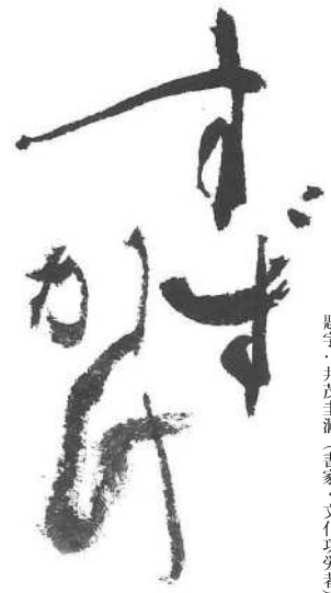
題字・井茂圭詞(書家・文化功労者)