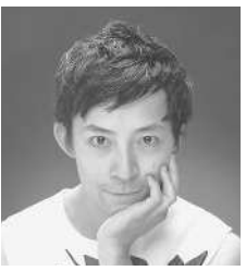
三坂 賢二郎 (森 林太郎)

明治以降、突然猛威を振るい、昭和初期に至るまで年間1万人以上の死者を出すほど流行した近代日本最悪の病「脚氣」。人々は原因究明に奔走する。陸軍医・森林太郎のちの大家・森鷗外を終