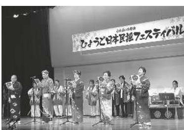
ひょうご日本民謡フェスティバル