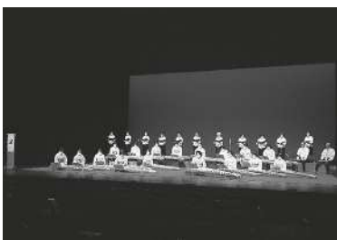
ひょうご邦楽の祭典