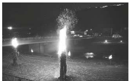
竹田地区松明祭保存会