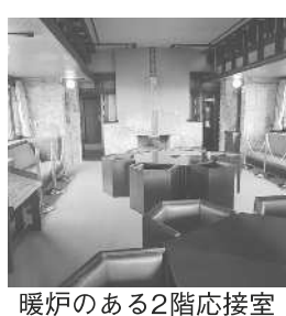
暖炉のある2階応接室

4階の暖炉がある食堂をとおつて、バルコニーへ出て南を見ると、芦屋市街の眺望がすばらしい。