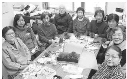
杉原紙振興ボランティア