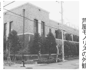
芦屋モノリスの外観