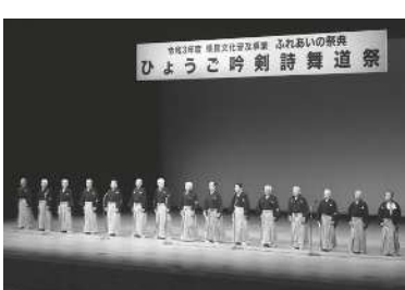
ひょうご吟剣詩舞道祭