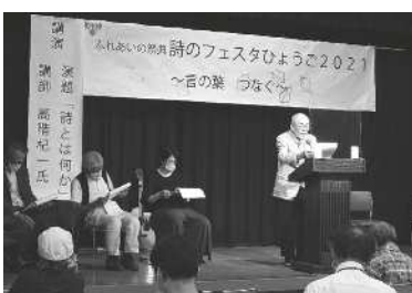
詩のフェスタひょうご