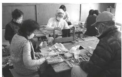
淡路木偶づくり講座