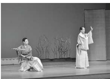
ひょうご名流舞踊の会