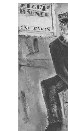
佐伯祐三「郵便配達夫」 1928年 大阪中之島美術館

■大阪中之島美術館開館記念「Hello! Super Collection 超コレクション展 99のものがたり」