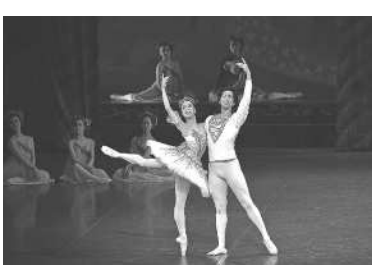
ひょうご洋舞フェスティバル