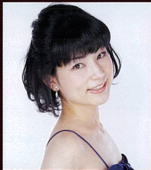
写真:東京二期会コンチェルトタンテ・シリーズ『エロディアード』2019年4月 Bunkamura オーチャードホール

大阪音楽大学声楽科を卒業。新国立劇場オペラ研修所第5期生修了。平成23年度(第22回)五島記念文化新人賞受賞しニューヨークで研修。第18回ABC新人コンサート・オーディション最優秀賞。第25回飯塚新人音楽コンクール第1位。第37回イタリア声楽コンクール・ミラノ大賞(副賞によりボローニャ音楽院に留学)、第27回奏楽堂日本歌曲コンクール第1位等、受賞多数。新国立劇場公演、二期会、小澤征爾音楽塾、東京オペラの森、サイトウ・キネン・フェスティバル松本、日生劇場、佐渡裕プロデュースオペラ等において、『フィガロの結婚』伯爵、『ドン・ジョバンニ』表題役、魔笛『パパゲーノ』、『セザリアの理髪師』フィガロ、バルトロ役、『愛の妙薬』ベルコレ、『イル・トロヴァトーレ』(三菱UFJ信託音楽賞)ルーナ伯爵、『椿姫』ジェルモン、『仮面舞踏会』レナート、『外套』(三菱UFJ信託音楽賞奨励賞)ミケーレ、『ラ・ボエーム』マルチェッロ、『トゥーランドット』ピン、『道化師』トニオ、『カルメン』エスカミーリョ、モラレス、『スペインの時』ラミーロ、『エロディアード』ヘロデ、『トリスタンとイゾルデ』メロート、『ゼッキンゲンのトランペット吹き』ヴェルナー、『こうもり』アイゼンシュタイン、『メリー・ウイダー』ダニロ、『エフゲニー・オネーギン』隊長、『夕鶴』運ず、『沈黙』(文化庁芸術祭大賞)キチジロー『黄金の国』(佐川吉男賞)フェレイラ、『ピーター・クライムズ』(三菱UFJ信託音楽賞)バルストロード等、様々なオペラに出演している。また「第九」のほか、モーツァルト、ヴェルディ、フォーレ、三木稔「レクイエム」、モーツァルト「戴冠式ミサ」、ハイ든「四季」「天地創造」、ブラームス「ドイツレクイエム」オルフ「カルミナ・ブラーナ」等のソリストも務める。2010年NHK-FM「名曲リサイタル」「リサイタル・ノヴァ」でも好評を博す。2018年、ヴァチカン国際音楽祭2018においてサンピエトロ大聖堂でヴェルディ「レクイエム」、グノー「聖チェチーリア荘厳ミサ曲」を演奏。西宮音楽協会、日本演奏連盟会員、二期会、堺シティオペラ各会員。奈良県立高円芸術高等学校音楽科講師。