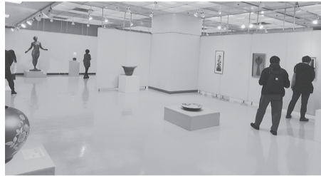
昨年の会場の様子

【参加団体】兵庫県美術家同盟、兵庫県日本画家連盟、兵庫県書作家協会、兵庫県工芸美術作家協