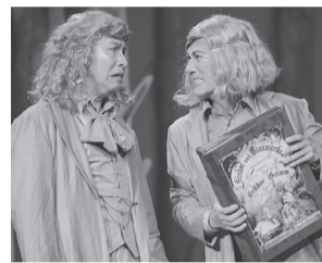
2021年8月ピッコロシアター公演より