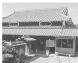
ローゼンファームズカフェ

お昼は、西区伊川谷町前開のローゼンファームズカフェで、ベジタブルプレートランチ(1650円、税込)を食した。