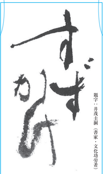
題字：井茂圭洞(書家・文化功労者)

日本を代表するオーケストラから、コンサートマスターや首席奏者を中心に編成した「ジャパン・ヴィルトゥオーゾ・シンフォニー・オーケストラ」のニューイヤーコンサートが、県立芸術文化センターで開催されます。多くの芸術文化事業が新型コロナウイルス感染症の影響を大きく受けているなか、この公演が新しい年の幕開けを飾るとともに、再び芸術文化活動が活発に展開されていくきっかけの一つとなればと願って開催されます。