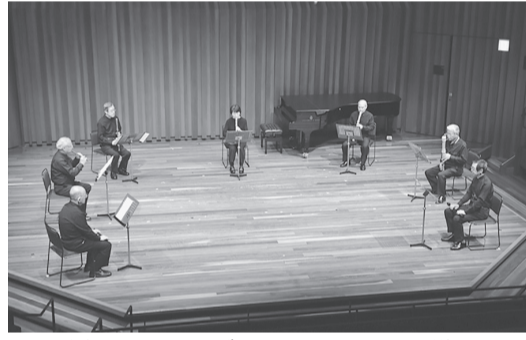
昨年のアンサンブルフェスティバルの様子

【日時】12月19日(金)～21日(日)10時～17時(最終日は15時まで) 【場所】原田の森ギャラリー 【入場料】無料(要整理券) 【問い合わせ】アンサンブル・フェスティバル兵庫2021 in 赤穂実行委員会(アートフォレスト内) ☎078・367・3560