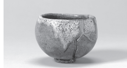
重要文化財 赤楽茶碗 銘雪峯 本阿弥光悦作 【通期展示】 畠山記念館蔵

■特別展「畠山記念館の名品一能楽から茶の湯、そして琳派」 ①前期11月7日(日)まで、後期11月9日(火)～12月5日(日)※会期中、一部作品に展示替えあり ㊨9時～17時30分、入館は17時まで ㊩月曜日 ㊩一般1800円、大学生1200円、高校生700円、中学生以下無料※事前予約優先制 ㊪荏原製作所の創業者である畠山一清(号:即翁)が蒐集した美術品を収蔵する畠山記念館。本展は、改築工事のため休館中の同館コレクションの中から、茶道具を中心とする日本、中国、朝鮮の古美術の名品を紹介します。即翁の蒐集品には「即翁與衆愛玩」の蔵印があり、その言葉は自ら蒐集品を独占するのではなく多くの人と共に楽しみたいとの即翁の想いが込められています。即翁の美意識と彼が愛した古美術の世界を共有できる関西初の展覧会です。㊭㊮京都国立博物館 平成知新館 ☎075・525・2473(テレホンサービス)★3組6人に。12日(金)必着