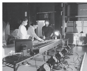
舞台技術学校風景

ピッコロシアターの運営する「ピッコロ演劇学校」(1983年開設)と「ピッコロ舞台技術学校」(1992年開設)では、来年度の学校生募集に向けて、オープンキャンパスを行います。 両校では、第一線で活躍するプロの講師陣が直接指導します。週2回、夜間開講なので、社会人や学生でも無理なく通えます。公立ならではのリーズナブルな授業料も魅力です。