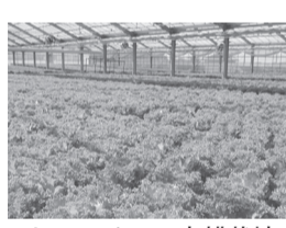
リーフレタスの水耕栽培