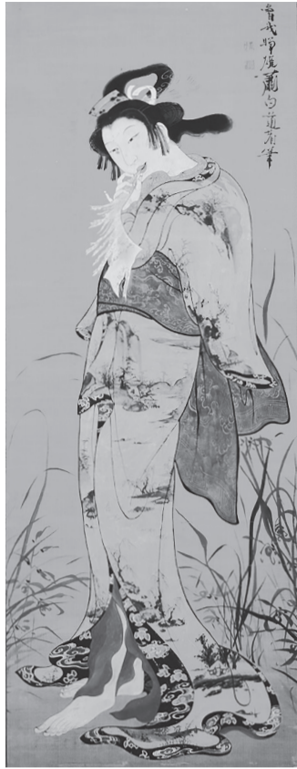
美人図 一幅 江戸時代(18世紀) 絹本着色 奈良県立美術館蔵

【日時】令和4年1月18日(火)14時～15時30分 【場所】兵庫県民会館303号室 【受講料】一般1500円、会員500円 【定員】45人 【問い合わせ・申込み】当協会文化振興部