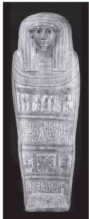
後期王朝時代の外棺(蓋) 長さ199cm、幅72cm、高さ38cm