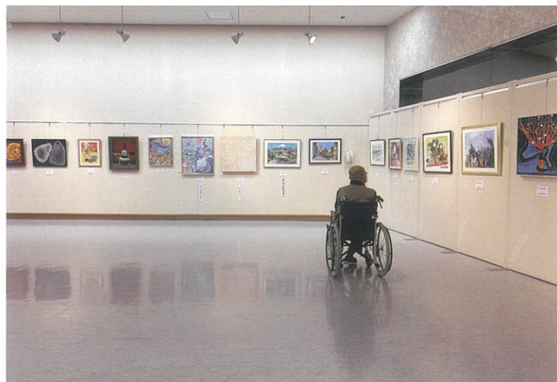
(2025年度小品部門会場風景)