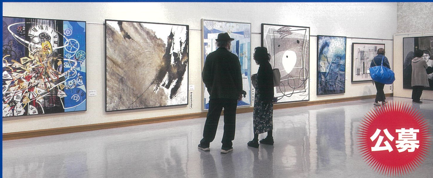
(2025年度大作部門会場風景)