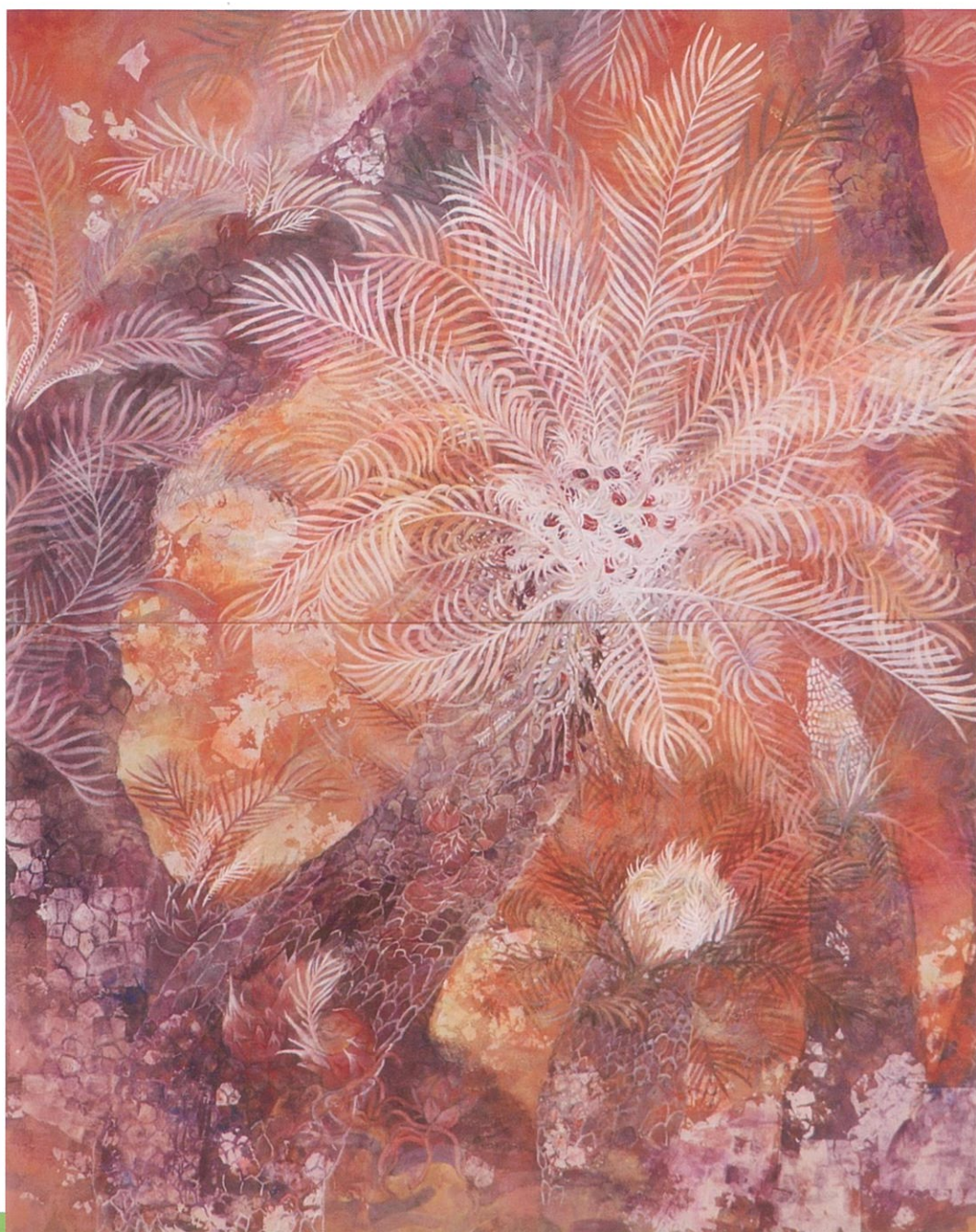
第70回公募展 兵庫県日本画家連盟賞 受賞作品 『ソテツの森』/ F100号 手井 弘恵