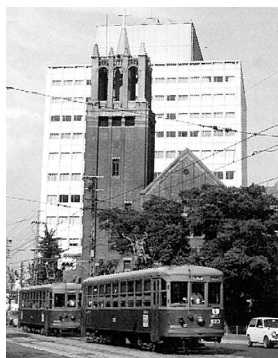
「(財)兵庫県文化協会三十年のあゆみ これまでそしてこれから」より

【内容】開館初期、総合結婚式場運営期、阪神・淡路大震災の被災状況等の写真・資料など