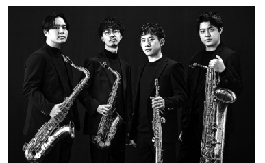
ザ・レヴ・サクソフォン・クワルテット