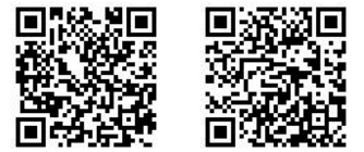
神戸六甲ミーツ・アートde元気ネットワークひょうご

休業(月曜祝日の場合は火曜休) ※会場により一部異なります。県内7か所で開催される芸術祭「アートde元気ネットワークひょうご」の詳細は、二次元コードで。「アートde元気ネットワークひょうご」の詳細は右の二次元コードから。