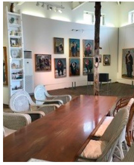
メインギャラリー2階展示室

淡路島の西海岸、遠浅で波が穏やかな尾崎海水浴場では「海ホタルショー」が開かれています。海ホタル(海蛍)は甲殻類の一種で、体長約3mm。温暖な沿岸に生息し、夜間に青く神秘的に光ります。幻想的な景観を体感して楽しむ参加型イベントですが、安全と快適さに配慮して参加人数を限定しています。星空の下、海ホタルの生態が分かりやすく解説され、海ホタルすくい、海ホタル花火、海ホタル花吹雪などを体験できます。