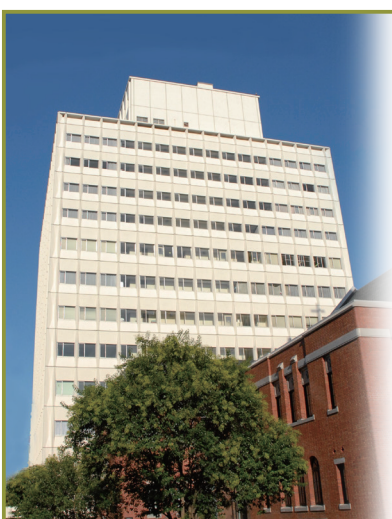
駐車場36台完備(24時間営業)