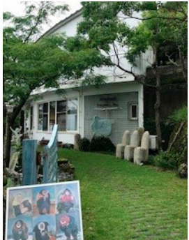
メインギャラリーの外観

そうな表情とともに描かれています。朝市を愛し、足繋ぐ通った大石の心が伝わってくるようです。絵本は1100円で販売しており、売り上げは被災地支援に充てられます。